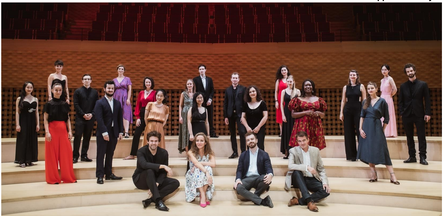
Président Fondateur de l'Académie Musicale